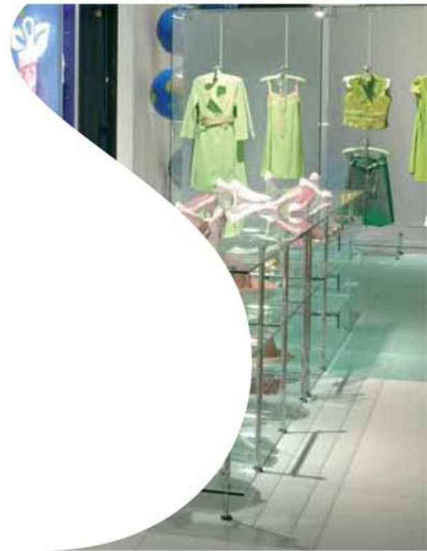
→ Glass Fritz Store (Switzerland)

An international and Spanish leader in obtaining the Quality ISO 9001 and Environmental Safety ISO 14001 certificates. Strict routine controls give SEVASA the seal of an eco-friendly and sustainable company.