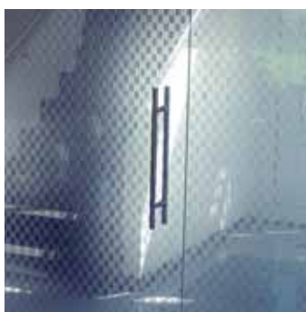
→ CriSamar® California Detalle divisoria Wallscreen detail