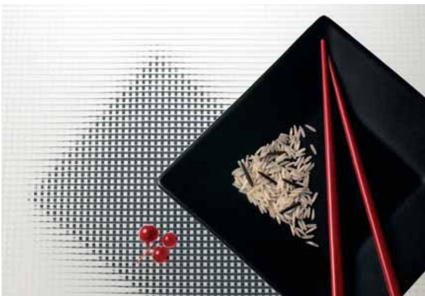
↓ CriSamar® Quadra Mesa Table

CriSamar®. Decorating with the senses, design based on emotions.